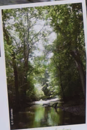
Forêt alluviale en bordure de Saultre