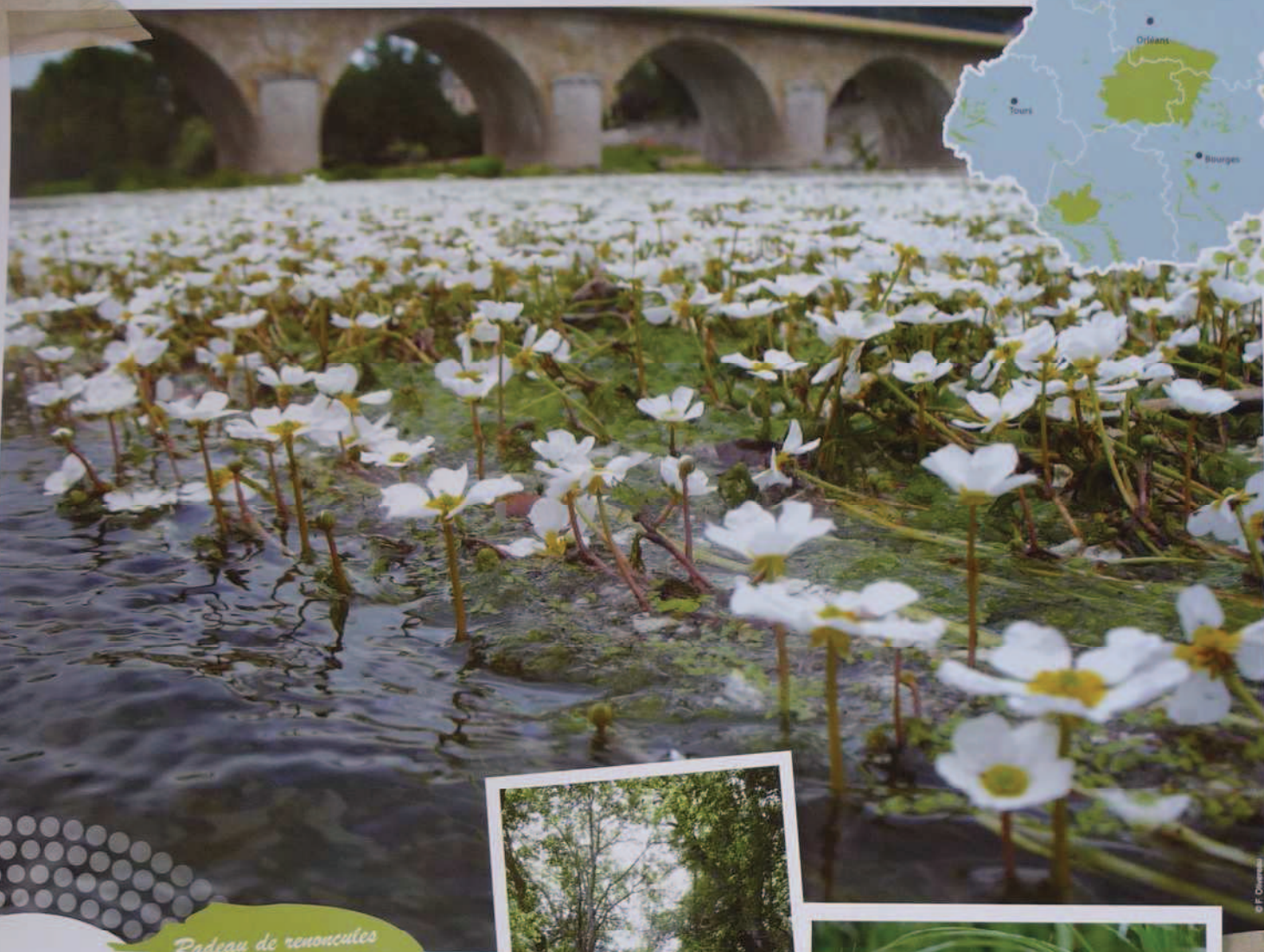
Radeau de renouées aquatiques sur le Cher

Des petits ruisseaux aux grandes rivières, la région Centre abrite un réseau très dense de cours d'eau , jouant un rôle important en tant que corridors écologiques. En fonction de leur taille, de leur débit et de la dynamique fluviale, ils accueillent des milieux naturels spécifiques, tels les radeaux à renouées, et un grand nombre d'espèces souvent méconnues.