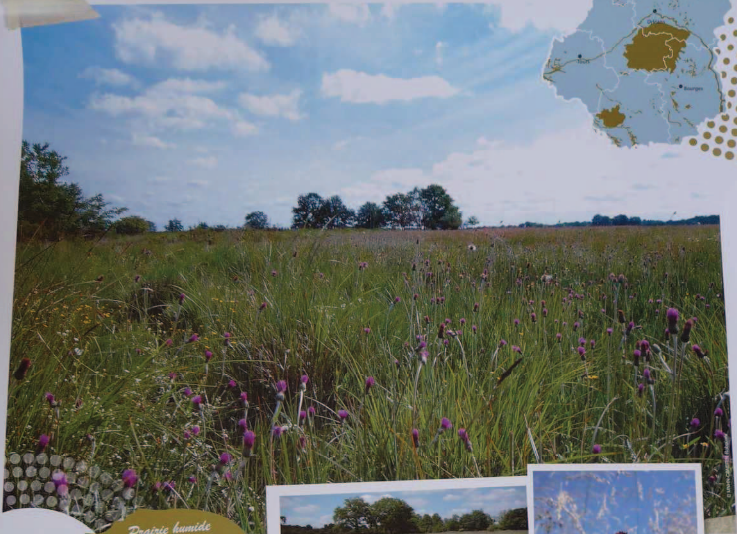
Prairie humide acide

Les prairies de fauche, les prairies humides et les lisières à hautes herbes (mégaphorbiaies), en régression en région Centre en raison de la déprise agricole, présentent une végétation à la flore riche et colorée, haute et diversifiée ainsi que de nombreux insectes ou oiseaux d'intérêt patrimonial.