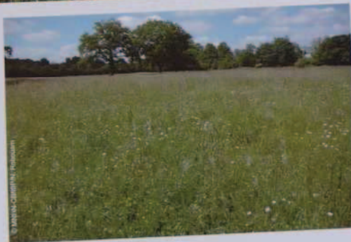
Prairie de fauche

Les prairies de fauche, les prairies humides et les lisières à hautes herbes (mégaphorbiaies), en régression en région Centre en raison de la déprise agricole, présentent une végétation à la flore riche et colorée, haute et diversifiée ainsi que de nombreux insectes ou oiseaux d'intérêt patrimonial.