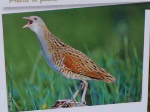
Râle des Genêts