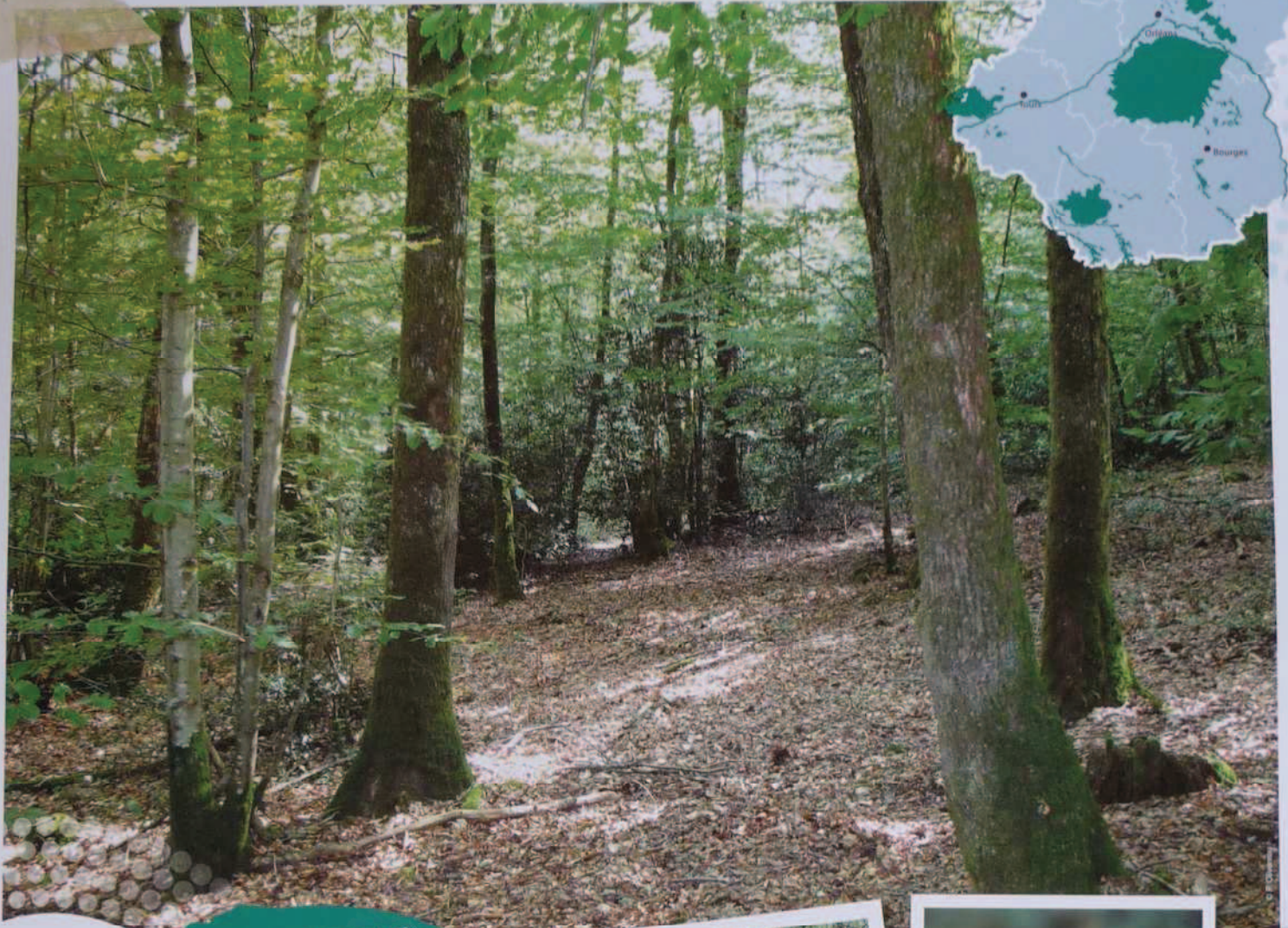
Hêtraie - chênaie à Houx

Si la majeure partie des milieux forestiers de la région Centre ne sont pas d'intérêt européen, certains sont cependant concernés, telles les forêts à Chêne tauzin ou certaines hêtraies. Variés dans leurs faciès, ces forêts sont le refuge de nombreuses espèces rares, notamment des oiseaux (rapaces, pics) ou des insectes (coléoptères des vieux bois...).