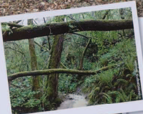
Forêt de ravin

Si la majeure partie des milieux forestiers de la région Centre ne sont pas d'intérêt européen, certains sont cependant concernés, telles les forêts à Chêne tauzin ou certaines hêtraies. Variés dans leurs faciès, ces forêts sont le refuge de nombreuses espèces rares, notamment des oiseaux (rapaces, pics) ou des insectes (coléoptères des vieux bois...).